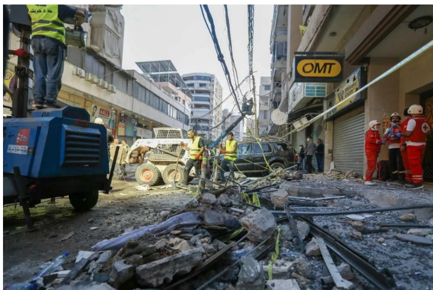
Beirut, Libano. Macerie dopo uno strike israeliano contro Hezbollah nella zona sud della città

Quella che non fa notizia, ma che è l'unico fatto che rimane.